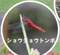
ショウジョウトンボ